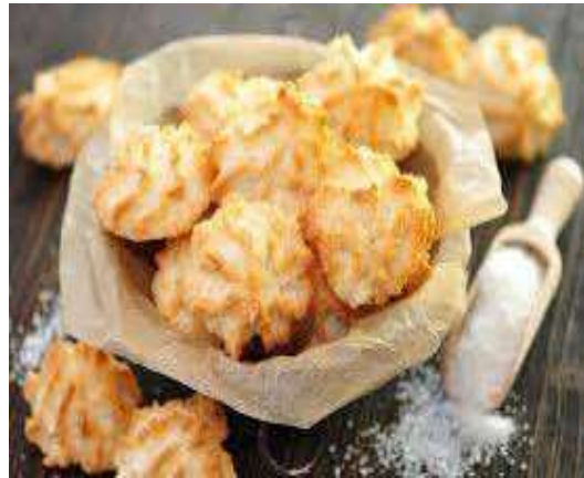
Gambar 2. “ kokosmakronen “