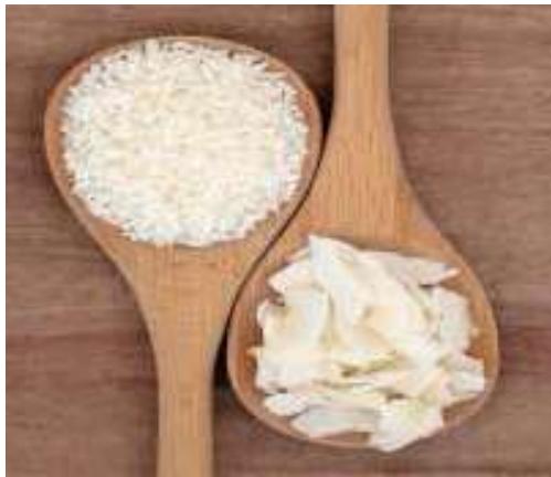
Gambar 1. Desiccated coconut (Granuls & flakes size)

Desiccated coconut termasuk produk eksotis di Eropa. Produk ini banyak digunakan sebagai bahan roti tradisional di banyak negara Eropa seperti “ Kokosmakronen “ di Belanda atau “ Coconut Macaroons “ di Inggris. Selain itu, produk ini banyak juga digunakan dalam produk sereal sarapan.